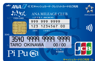
おきぎんJCB 「PiPuCa ANAマイレージクラブカード (Edy付)」