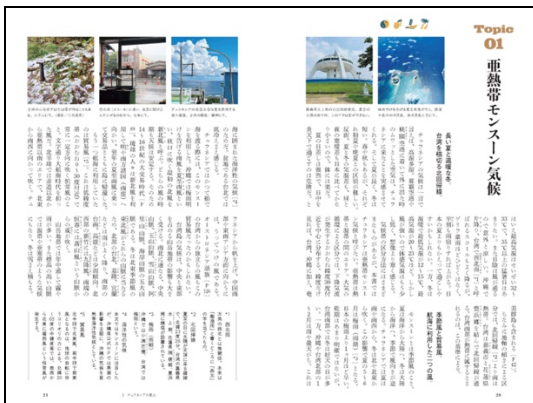
1 チュラネシアの風土/Topic01 亜熱帯モンスーン気候