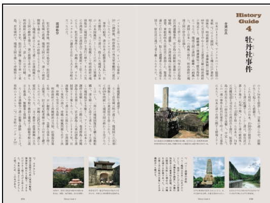
History Guide 4/牡丹社事件