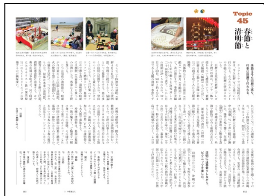
3 中華圏文化/Topic45 春節と清明節