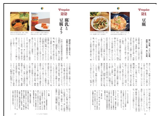
2 チュラネシアの食文化/Topic21・22 豆腐・腐乳と豆腐よう