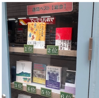
東京堂書店週間ランキング

■東京・神保町の大手書店、東京堂書店では発売後の週間総合売上ベスト 3 位→1 位→2 位と推移中。 ジュンク堂書店那覇店でもテーブルで大きく展開。