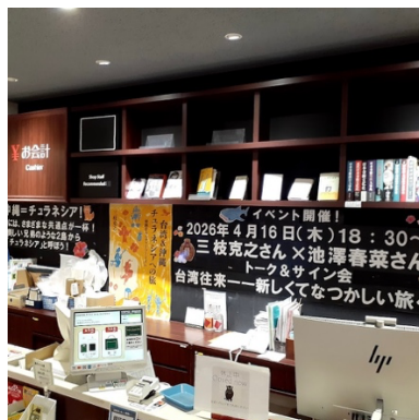
東京堂書店カウンターのパネル