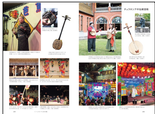
6 チュラネシアの工芸と芸能/チュラネシアの伝統芸能