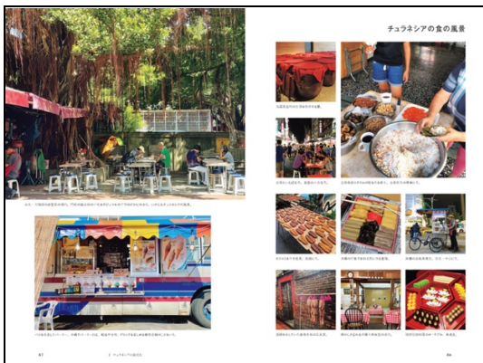
2 チュラネシアの食文化/チュラネシアの食の風景