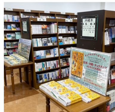
ジュンク堂書店那覇店の平積み