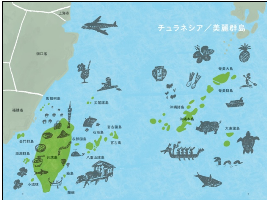
巻頭/チュラネシアMAP