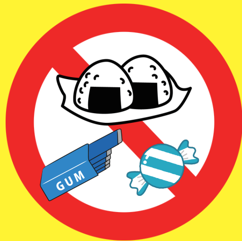
食べ物 (小麦粉など)